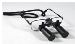
4.0・5.0・6.0 倍の外観写真