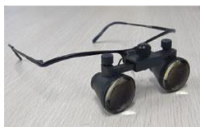
レンズレスタイプ